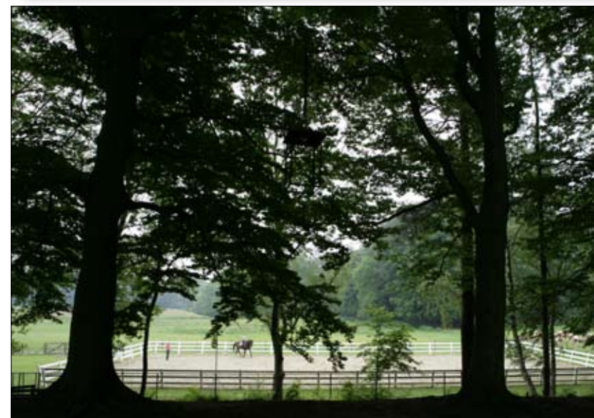
'De Rijschool' is geschilderd tussen 1637-1674 door Johannes Lingelbach. De hedendaagse manege is de Vondelmanege in Amsterdam. Zij hebben een Carrousselgroep waar de vrouwen op vrouwenzadels rijden. De onderste foto is een privés in Huizen.